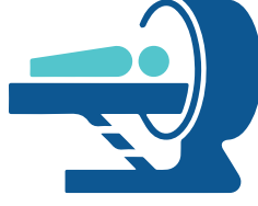
KLİNİK RİSK FAKTÖRÜ OLAN BİREYLERDE OSTEOPOROZ TARAMASI