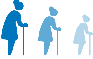
YILLIK BOY ÖLÇÜMÜ