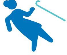
DÜŞME RİSKİ TARAMASI